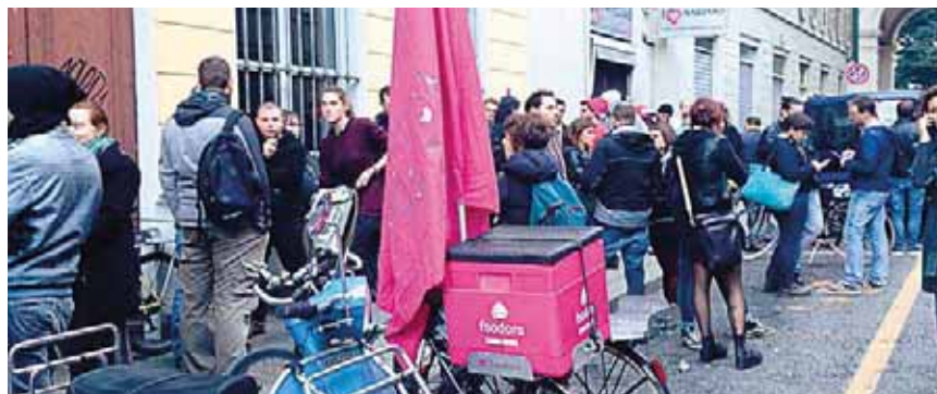
Sciopero dei fattorini di Foodora (start up tedesca per la consegna dei pasti a domicilio) che hanno denunciato bassi compensi ed estrema flessibilità degli orari (ottobre 2016).