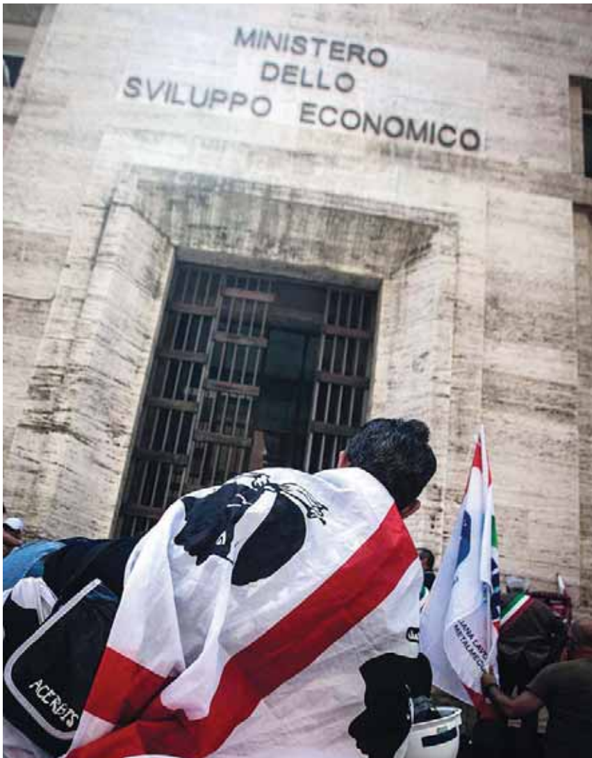
Protesta davanti alla sede del Mise che ha promosso il piano Industria 4.0 ma deve gestire 162 tavoli di crisi, a cominciare dall'Ilva dove i franco-indiani di Acelor Mittal, assieme al gruppo Marcegaglia, prevedono da 4 a 6 mila esuberanti.