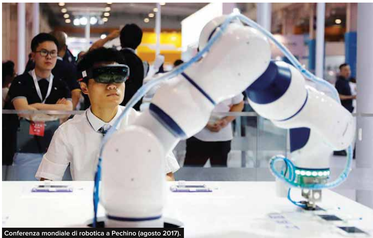
Conferenza mondiale di robotica a Pechino (agosto 2017).